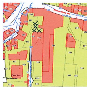
Parking fond impasse Franquebalme

× × × × × STATIONNEMENT INTERDIT lors de l'intervention de Signal26